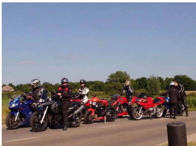
Wachten voor bruggen hoort er helaas ook bij...