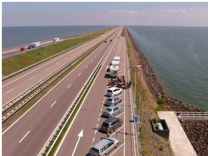
Blijft een machtig bouwwerk, de Afsluitdijk