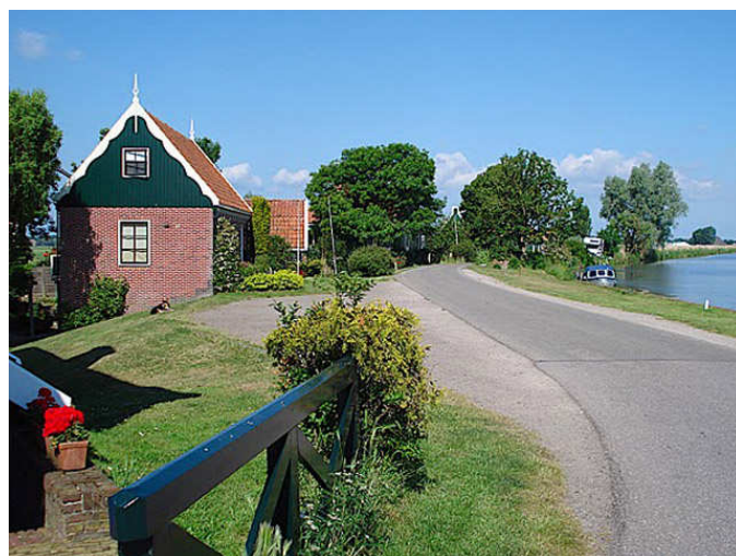
Hollandse vergezichten en luchten